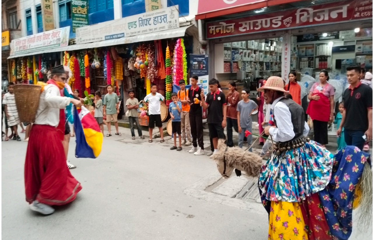
नेवार समुदायले एक महिना सम्म मनाउने वर्षे नाच अन्तर्गतको घोडा नाच प्रदर्शन गरिदै ।