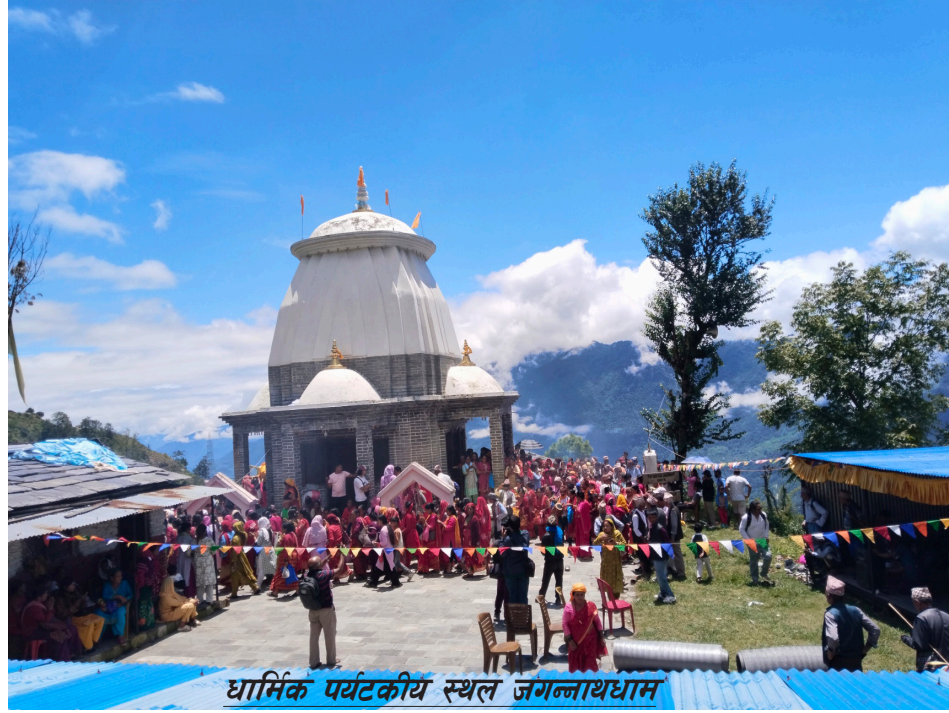
धार्मिक पर्यटकीय स्थल जगन्नाथधाम

धौलागिरी हिमश्रृङ्खला र अन्नपूर्ण हिमश्रृङ्खलालाई कालीगण्डकीको खोंचले छुट्याएको छ । यही नै खोज हो जुन अन्धगल्छीको रूपमा संसार कै गहिरो रूपमा कृतिमानी छ । कालीगण्डकी, म्याग्दी खोला, रघुगंगा, मिरस्ती खोला, रूम खोला, दरखोला, गुरगंगा खोला जस्ता खोलानाला म्याग्दी नदी र कालीगण्डकीले आफूमा समाहित गराएका छन् । यो जिल्लाको प्रख्यात बेनी जोमसोम सडक खण्डमा पर्ने रूपसे भरना, दरखोलाको भरना, हिस्तान, नारच्याङ भरना, मराङ खोलामा अवस्थित भरना, सिंगा तातोपानी कुण्ड, दर्मीजा तातोपानी कुण्ड, मुदी तातोपानी कुण्ड, नारच्याङ तातोपानी, पाउद्वार तातोपानी, मुदीको तातोपानीको भरना, बगर तातोपानी जसता अनेकन तातोपानी कुण्डहरू प्रकृतिक चिकित्साक तथा हटस्प्रीडका लागि उल्लेख्य श्रोतकोरूपमा रहेका छन् । सशस्त्र द्वन्द्वले १० वर्ष सम्म थलीएको यस जिल्ला २०६२/०६३ को सफल जनआन्दोलनले दिएको परिवर्तनले यस जिल्लामा बाँकी पाँचौं पृष्ठमा