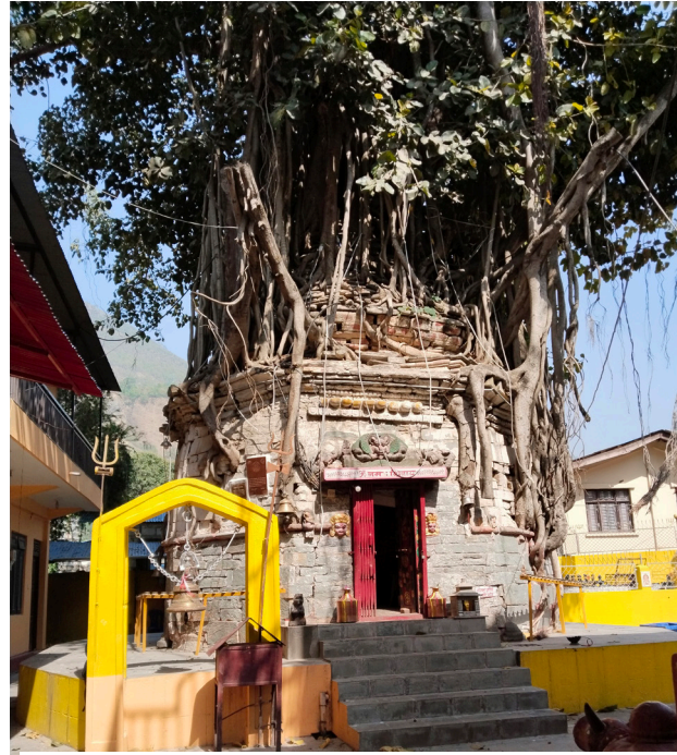
बेनी बजारमा रहेको चार सय वर्ष पुरानो भर्तीवम शिवालय उचित प्रचारको अभावमा पर्यटकको आगमन यस मन्दिरमा सोचे जस्तो हुन सकेको छैन ।

खेतीपाती गर्ने भारतीय तथा ब्रिटिस सेनामा भर्ती हुने परम्परा रहेको यो जिल्ला हाल पनि वैदेशिक रोजगार